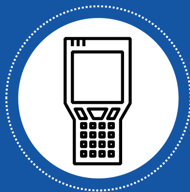
Терминалы сбора данных